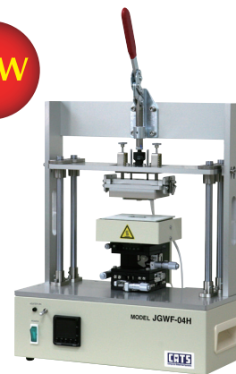
JGWF-04H : (W)336×(H)566×(D)185