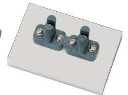
Diode / ダイオード用

高温300°Cと220°Cの2タイプ 2 types of high temperature socket of 300°C and 220°C.